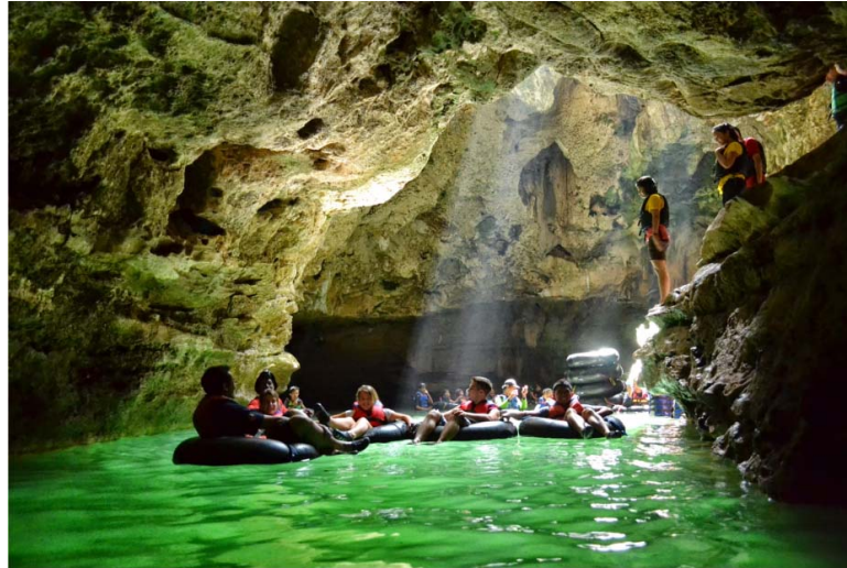
Gambar 2. Overcapacity Daya Tarik Wisata Alam Goa Pindul