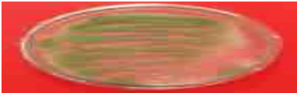
Gambar 1. Koloni A.flavus pada cawan petri

Hasil dari tahap isolasi A.flavus yang telah dimurnikan pada cawan petri dilihat pada Gambar 1, dan hasil pengamatan A.flavus diamati dibawah mikroskop dengan pembesaran 400x dapat dilihat pada Gambar 2.