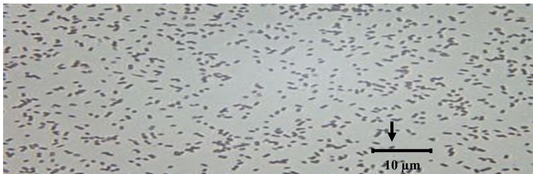
Gambar 2. Morfologi Staphylococcus aureus dengan Mikroskop Pada Pembesaran 1000x. Keterangan :

Hasil pengamatan morfologi atau bentuk terhadap sampel dengan menggunakan mikroskop yang dilakukan selama penelitian menunjukkan S.aureus , memiliki bentuk bulat dan berkoloni. Bentuk morfologi S.aureus dapat dilihat pada Gambar 2.