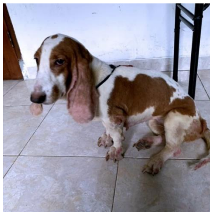
Gambar 1. Kondisi anjing kasus tampak lesu dengan postur membungkuk.

Anjing kasus dipelihara dengan cara dilepaskan di dalam pekarangan rumah. Selama pemeliharaan anjing diberikan pakan kering (Canibite® PT. Matahari Sakti, Surabaya, Indonesia) yang dicampur dengan rebusan hati ampela dan nasi. Pakan seperti tersebut telah diberikan dua tahun terakhir dengan frekuensi pemberian dua kali sehari. Pemberian minum dilakukan secara ad libitum . Anjing kasus sudah diberikan vaksinasi lengkap dan obat cacing.