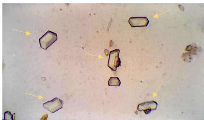
Gambar 3. Hasil pemeriksaan ditemukan adanya kristal struvit (pada panah kuning)

Pemeriksaan sedimen urin. Pemeriksaan sedimen urin dilakukan dengan cara mengambil sampel urin dari hasil urinasi anjing kasus, yang disentrifugasi selama lima menit dengan kecepatan 1000 rpm dan dilanjutkan dengan pembuatan preparat natif, lalu dilakukan pemeriksaan di bawah mikroskop cahaya dengan pembesaran 100 kali. Hasil pemeriksaan ditemukan kristal magnesium ammonium phosphate atau (struvit).