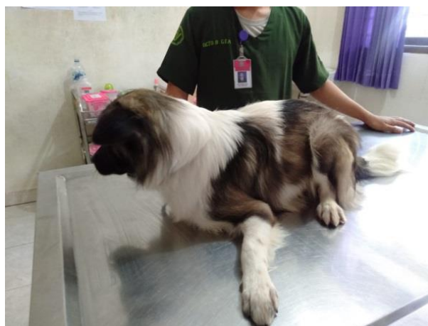
Gambar 1. Dokumentasi pribadi anjing kasus

Anjing ras kintamani berjenis kelamin jantan dengan umur satu tahun memiliki bobot badan 9,2 kg. Anjing memiliki rambut berwarna hitam putih, berpostur tubuh tegap, behavior dan habitous pendiam.