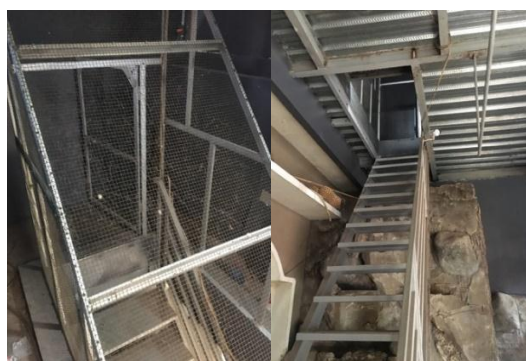
Gambar 3. Pengamanan kandang murai batu dalam penangkaran

Pengkayaan kandang sangat berperan penting agar burung murai dapat merasa seperti di habitat aslinya dan dapat terhindar dari stres akibat perubahan tempat (BKSDA, 2007). Pengamanan kandang reproduksi terdapat pengaman pintu masuk berupa kawat ram, besi serta dilengkapi dengan gembok dan kamera pengaman.