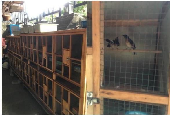
Gambar 2. Kandang makan murai batu

Dimensi bebas dari ketidaknyamanan berkaitan dengan kondisi tempat yang ditinggali oleh satwa salah satunya adalah kandang reproduksi. Pengondisian suhu sudah baik karena ketika cuaca panas, pengelola melakukan penyiraman tanah yang berada di dalam kandang agar murai batu merasa nyaman. Menurut Peraturan Ditjen PHKA No. P.9/VI-SET/2011 dimensi bebas dari ketidaknyamanan adalah aspek yang disebabkan oleh cuaca yang tidak sesuai dengan habitat jenis satwa. Hasil skor penilaian dari pihak pengelola dalam dimensi bebas dari ketidaknyamanan yaitu 4,6 sedangkan menurut pengamat adalah 4,3 termasuk kategori baik.