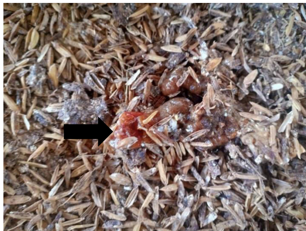
Gambar 3. Feses ayam terinfeksi Eimera yang mengandung darah.

Perubahan yang terjadi pada sekum disebabkan oleh ookista infeksius (mengandung sporozoit) termakan oleh ayam dan masuk ke dalam saluran pencernaan. Satu ookista yang infeksius mengandung delapan sporozoit (Rahmeto et al. , 2008). Dinding ookista akan pecah setelah masuk ke dalam lambung otot ( gizzard ) dengan bantuan enzim tripsin, sehingga sporokista-sporokista yang mengandung sporozoit keluar dari ookista. Enzim tripsin akan mendegradasi protein yang terkandung dalam dinding ookista. Pernyataan ini didukung oleh Stotish et al. (1978) yang mengatakan bahwa, komponen dinding ookista secara keseluruhan terdiri dari 67 % protein, 4% lemak, dan 9% karbohidrat. Sporokista tersebut akan masuk ke dalam usus halus. Setelah mencapai usus halus, sporozoit diaktifkan oleh tripsin sehingga sporozoit keluar dari sporokista dan memasuki sel epitelium sekum.