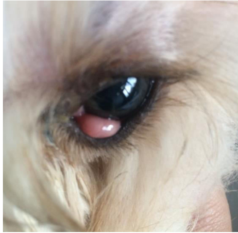
Gambar 2. Cherry eye pada anjing kasus

menunjukkan hewan mengalami anemia (Tabel 1) namun sebelum dilakukan operasi telah diberikan vitamin penambah darah.