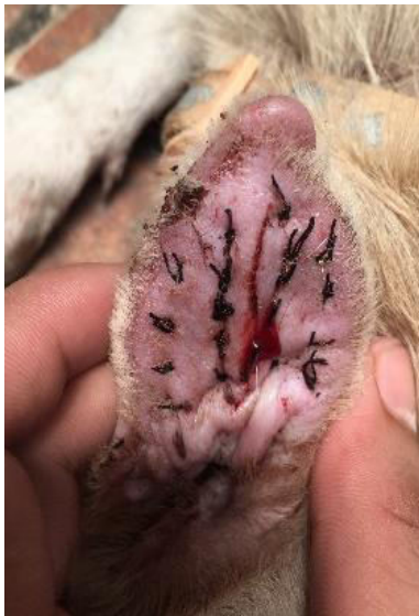
Gambar 3. Kesembuhan luka masih pada fase inflamasi

bertujuan untuk mencegah terjadinya infeksi sekunder dengan cara menurunkan atau mengeliminasi bakteri patogen sampai sistem pertahanan tubuh mampu megatasinya sendiri (Plumridge, 1998). Obat yang memiliki efek kombinasi anti-inflamasi dan analgesik adalah golongan NSAIDs (Goodman, 2007). Sistem kerja obat yaitu menurunkan produksi prostaglandin dan tromboksan. Prostaglandin merupakan hasil metabolisme utama dari asam arakhidonat yang dihambat oleh NSAIDs sehingga proses inflamasi dapat dihambat dan rasa nyeri dapat ditekan (Zahra dan Corolla, 2017). Selain terapi pengobatan, makanan, vitamin, dan pemberian zat-zat tertentu merupakan sumber nutrisi pada penyembuhan luka (Zulfa et al. , 2008).