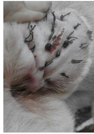
Gambar 5. Kesembuhan luka masih pada Maturasi (remodeling) .

Kesembuhan luka merupakan suatu proses yang kompleks dengan melibatkan banyak sel (Shenoy et al. , 2009). Proses kesembuhan dan regenerasi sel terjadi secara otomatis sebagai respon fisiologis tubuh (Ingold, 1993). Melibatkan proses seluler, fisiologis, biokemis, dan molekuler yang menghasilkan pembentukan jaringan parut atau perbaikan jaringan ikat (Velnar et al. , 2009). Terdapat tiga fase kesembuhan luka yaitu inflamasi , proliferasi (epitelisasi) , dan maturasi (remodelling) (Nurani et al. , 2015). Inflamasi akan terjadi respon peradangan oleh sel pertahanan tubuh (Sihotang dan Yulianti, 2018). Proliferasi terjadinya angiogenesis, epitelisasi, dan pembentukan jaringan granulasi (Tonnesen et al. , 2000). Maturasi terjadinya pembentukan jaringan penghubung seluler ( kolagenasi ) dan penguatan epitel baru (Zulfa et al. , 2008).