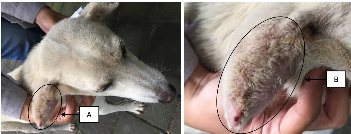
Gambar 1. (A) Anjing kasus mengalami pembengkakan pada pinna aurikula kanan; (B) Kulit pinna aurikula tampak kemerahan ( eritema ).

Status present anjing kasus adalah frekuensi jantung: 112^x/m , frekuensi pulsus: 108^x/m , frekuensi respirasi: 28^x/m , capillary refill time (CRT): < 2 detik, suhu: 38,8^{\circ}C . Hasil pemeriksaan fisik yaitu pinna aurikula kanan mengalami pembengkakan. Kulit pinna aurikula tampak kemerahan ( eritema ), berisikan cairan dan terasa hangat saat dipalpasi (Gambar 1).