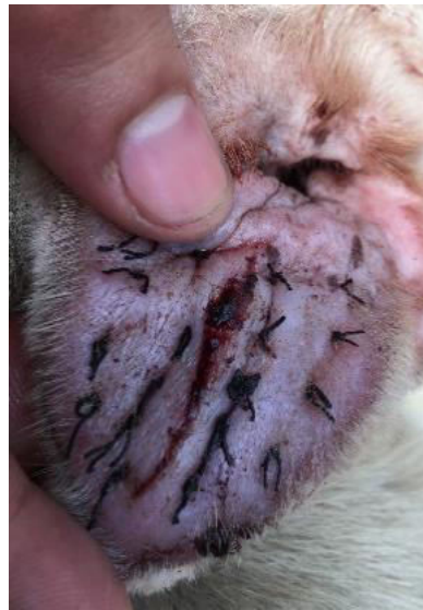
Gambar 4. Kesembuhan luka masih pada fase proliferasi