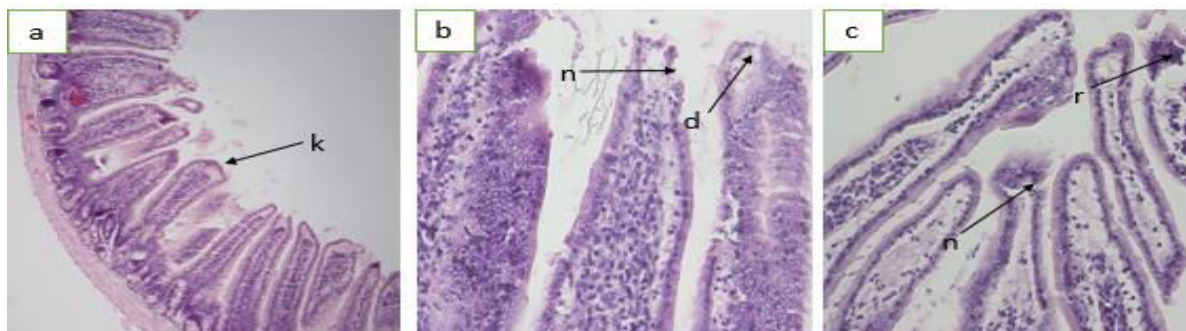
Gambar 2. (a) Gambar jejunum kontrol terlihat pada vili masih rata dan imtak, (b) mencit yang diberikan MSG, (n) Poliferasi pada leukosit pada epitel adanya nekrosis dan degenerasi sel enterosit, (c) mencit yang mendapat MSG kombinasi dengan ekstrak etanol kulit manggis, (r) infiltrasi sel radang pada epitel (HE, 40X).

Keterangan: Huruf yang berbeda pada kolom yang sama menunjukkan berbeda nyata.