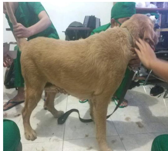
Gambar 2. Pemeriksaan fisik hewan kasus