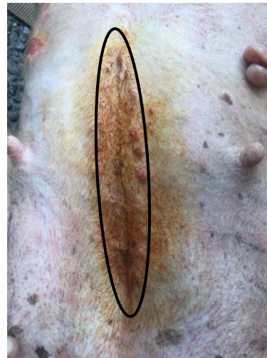
Gambar 3. Uterus yang berisi leleran Gambar 4. Bekas luka insisi hari ke-14 pasca operasi