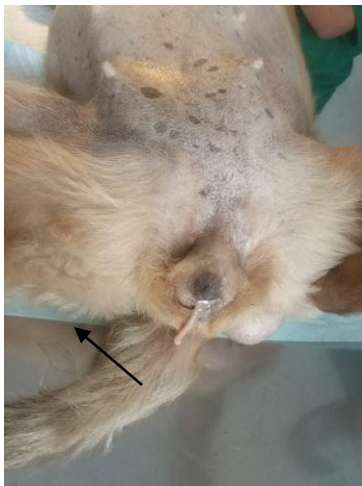
Gambar 1. Leleran vagina pada hewan kasus

antibiotika dan analgesik untuk mencegah infeksi dan mengurangi rasa nyeri. Antibiotika amoxicillin (R/ Amoxan Caps 500mg) diberikan 3x1 tablet sehari per oral selama lima hari, sedangkan asam mefenamat 500 mg diberikan 2x1 tablet sehari per oral selama lima hari berturut-turut. Pada hari kelima luka belum nampak sembuh dan muncul tanda-tanda radang sehingga terapi dilanjutkan dengan pemberian antibiotika ciprofloxasin (R/ Ciproxin 500mg) diberikan 2x1 tablet sehari selama tiga hari dan dexametasone 0,5 mg diberikan 3x1 tablet sehari selama tiga hari berturut-turut.