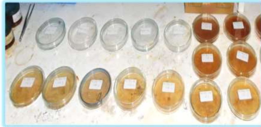
Gambar 1. Berbagai perlakuan uji vermisisidal cacing Ascaridia galli dalam cawan petri. Ekstrak metanol biji pepaya muda dalam berbagai konsentrasi. Semakin Coklat warnanya, semakin tinggi konsentrasi ekstrak biji pepaya muda

Pada pengujian ovisidal langsung, pada awal berembrio diketahui ada perbedaan nyata ( P < 0,05 ) antara berbagai konsentrasi ekstrak biji pepaya muda dengan kontrol, baik itu dengan kontrol negatif maupun kontrol positif. Sedangkan di antara ekstrak biji pepaya muda konsentrasi 0,28 % dengan 0,21 % dan di antara ekstrak biji pepaya muda konsentrasi 0,07 %, 0,14 % dan 0,21 % tidak terdapat perbedaan nyata ( P > 0,05 ) di antara satu dengan yang lainnya.