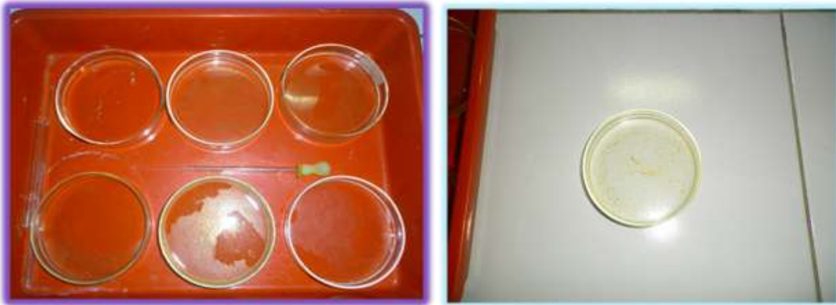
Gambar 2. Telur cacing Ascaridia galli dalam berbagai konsentrasi ekstrak biji pepaya muda