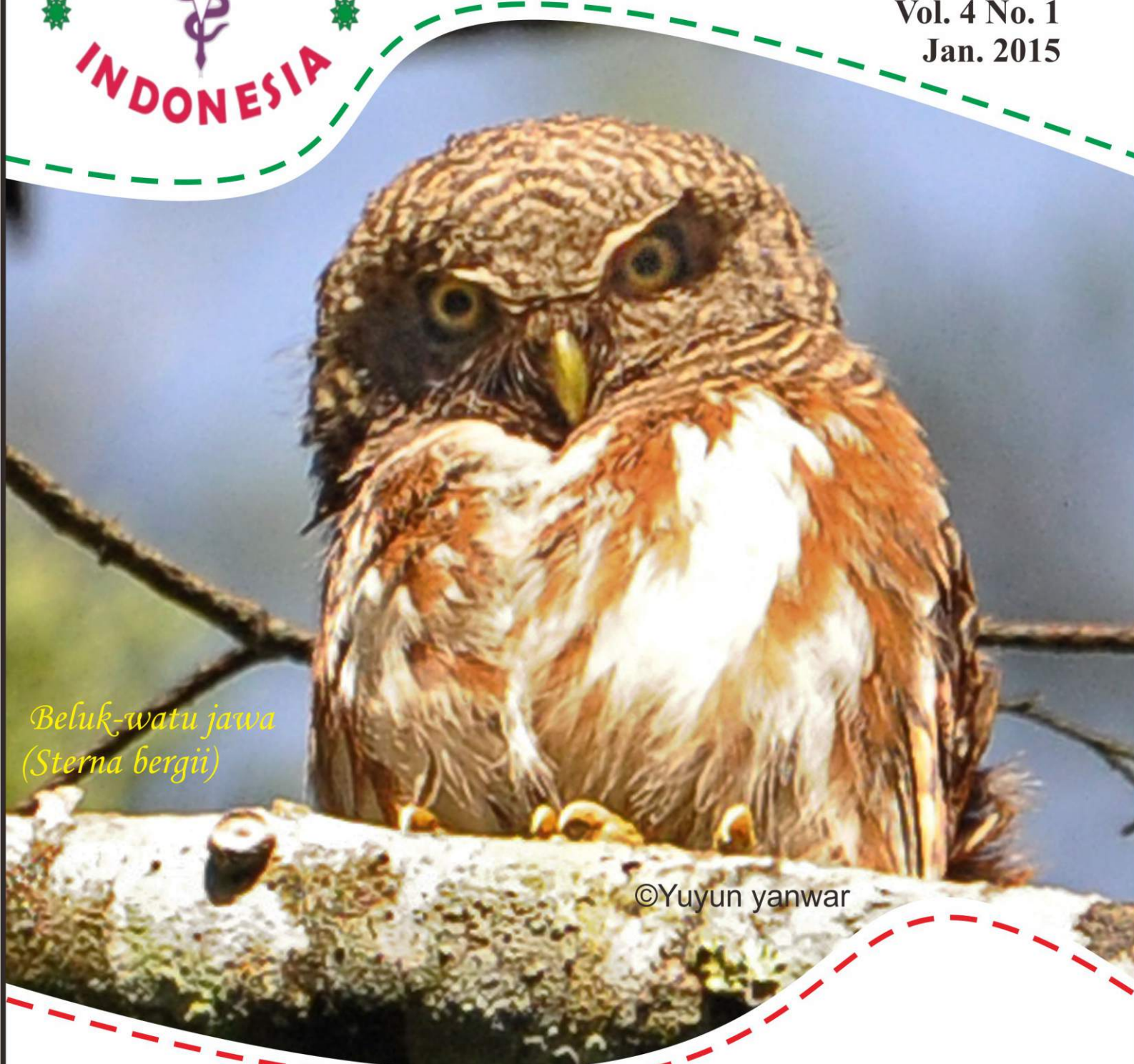
Beluk-watu jawa (Sterna bergii)