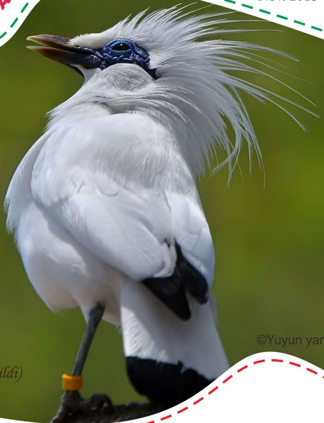
Jalak bali (Leucopsar Rothschildi)