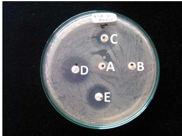
Gambar 2. Hasil Uji Sensitivitas Isolat pada Media Muller Hinton Agar . Kontrol negatif, b. penisilin G, c. Sulfametoksazol, d. Ampisilin, e. Streptomisin