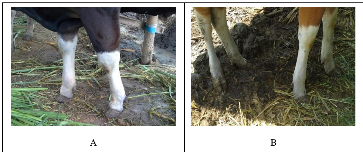
Gambar 3. Bentuk kuku normal. A. Sapi Bali jantan. B. Sapi Bali betina