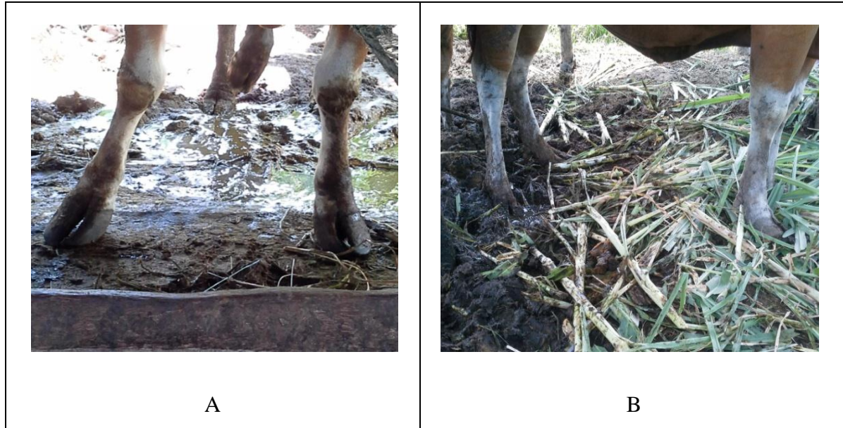
Gambar 2. Bentuk kuku panjang pada sapi Bali betina. A. Kuku bagian lateral lebih panjang, B. Kuku bagian medial lebih panjang.