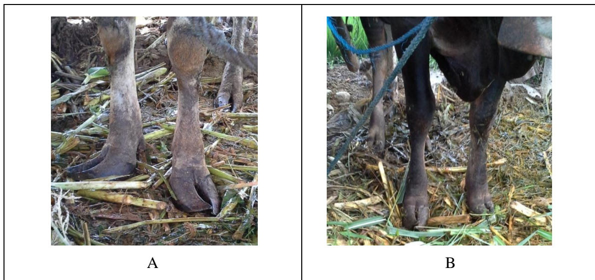
Gambar 1. Bentuk kuku panjang pada sapi Bali jantan. A. Kuku bagian lateral lebih panjang, B. Kuku bagian medial lebih panjang.

Pada penelitian ini juga dilakukan pengukuran terhadap panjang kuku sapi Bali yang dipelihara pada lahan lunak, baik pada kuku normal maupun kuku yang abnormal. Sesuai yang tertera pada tabel 2, diperoleh rata-rata panjang kuku sapi jantan yang normal adalah 8 cm dan rata-rata panjang kuku yang mengalami kelainan yaitu 11 cm. Sedangkan panjang rata-rata kuku sapi betina yang normal 8 cm dan yang mengalami kelainan yaitu 10,68 cm.