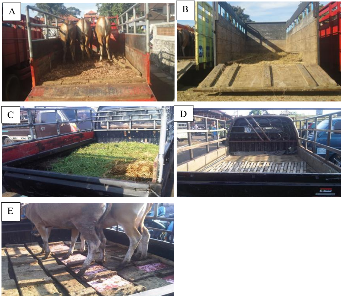
Gambar 2. Alas Bak Truk dan Pick-up . A. Serbuk gergaji, B. Jerami, C. Rumput, D. Anyaman Bambu, E. Papan kayu.

Berdasarkan anamnesis yang diperoleh, sapi terperosok pada waktu diturunkan dari truk, karena terdorong sapi yang lain. Tansportasi yang digunakan berupa truk sedang dengan alas jerami dan sapi berasal dari daerah Tabanan (Gambar 3. D).