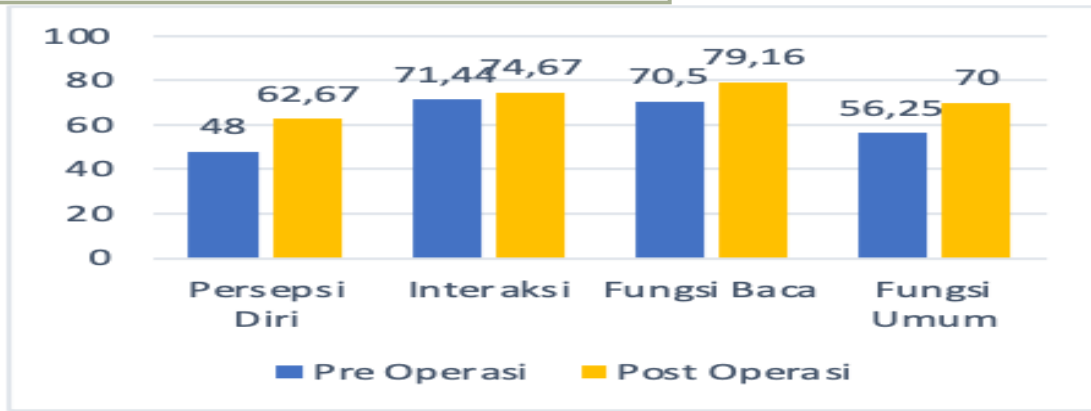
Gambar 2. Grafik rerata kualitas hidup pasien strabismus berdasarkan Kuesioner AS-20 domain persepsi diri, interaksi, fungsi baca, dan fungsi umum