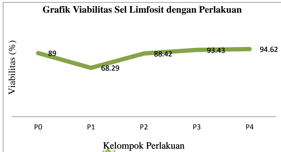
Gambar 3. Grafik Viabilitas Sel Limfosit dengan Perlakuan

Setelah perhitungan data secara deskriptif, dilanjutkan dengan pengolahan data secara statistik, yaitu : uji normalitas, uji homogenitas, uji One-Way ANOVA dan uji Post-Hoc .