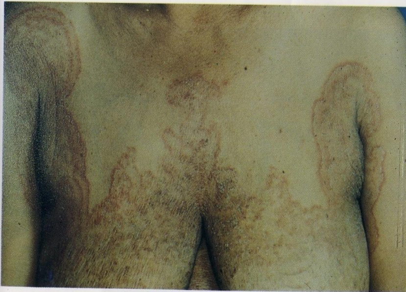
Gambar 10. Tinea korporis, luas Batas tegas, polisiklik