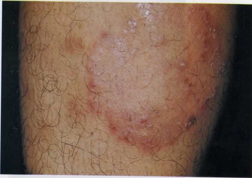
Gambar 9. Tinea korporis, bentuk subakut Lesi polimorf, batas tegas, central healing