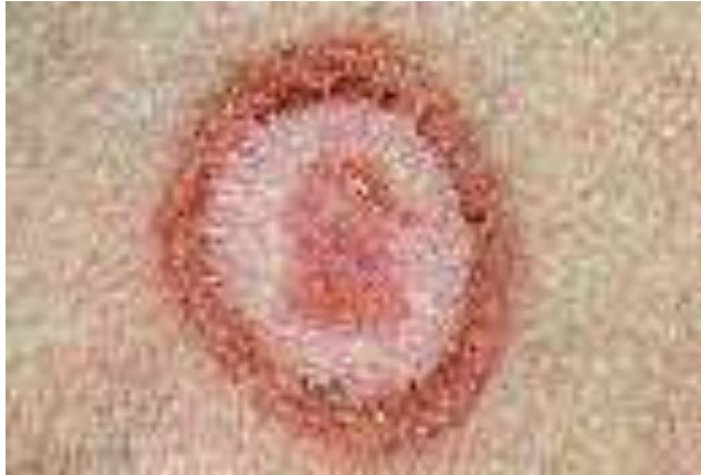
Gambar 3. Central Healing. Bagian tepi lesi lebih aktif (tanda peradangan), lesi bulat, berbatas tegas, terdiri atas eritema, papul ditepi lesi. Daerah tengahnya biasanya lebih tenang, bagian tepi terlihat aktif.