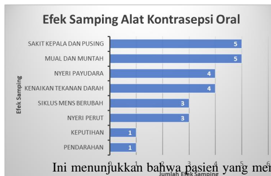
Gambar 1. Efek Samping Alat Kontrasepsi Oral

Ini menunjukkan bahwa pasien yang menggunakan alat kontrasepsi Oral dapat mengalami efek samping dari 8 pasien yang mengalami sakit kepala dan pusing sebanyak 5 orang (62,50%), mual dan muntah sebanyak 5 orang (62,50%), kenaikan tekanan darah 4 orang (50%), nyeri payudara sebanyak 4 orang (50%), nyeri perut sebanyak 3 orang (37,50%), siklus mens berubah sebanyak 3 orang (37,50%), kenaikan berat badan sebanyak 3 orang (37,50%), keputihan sebanyak 1 orang (12,50%) dan pendarahan sebanyak 1 orang (12,50%).