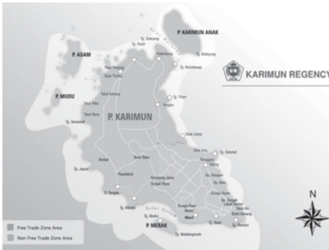
Gambar 2. Kabupaten Karimun

kelamin) di masa yang akan datang berdasarkan asumsi arah perkembangan fertilitas, mortalitas dan migrasi. Menurut Hauser dan Duncan (1959), mendefinisikan demografi yaitu demografi mempelajari jumlah, persebaran, teritorial, dan komposisi penduduk serta perubahan-perubahannya dan sebab-sebab perubahan itu, yang biasanya timbul karena natalitas (fertilitas), mortalitas, gerak teritorial (migrasi) dan mobilitas social (perubahan status). Data demografi sering juga disebut statistic demografi. Untuk mendapatkan data jumlah penduduk suatu negara atau daerah dibuat sistem pengumpulan data penduduk.