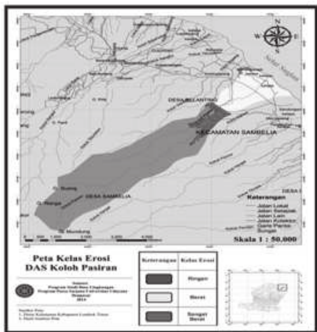
Gambar 1. Peta Kelas Erosi di DAS Koloh Pasiran

Erosi toleransi berkaitan erat dengan kedalaman efektif tanah dan umur guna tanah, semakin dalam solum tanah, dan semakin tinggi umur guna tanah maka nilai erosi toleransi akan semakin tinggi dan sebaliknya (Arsyad, 1989). Selanjutnya untuk dapat mengendalikan prediksi erosi (A) sama atau lebih kecil dari toleransi (T), diperlukan pemilihan tanaman/pola tanam (C) dan tindakan konservasi tanah (P). Laju erosi yang lebih besar dari erosi yang ditoleransi dijumpai pada unit lahan kebun