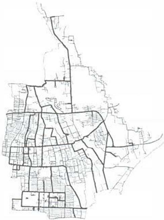
Gambar 4 Jalur Angkut Kontainer Rekomendasi

Rute pengumpulan sampah dapat dibuat dengan memperhatikan keterbatasan yang ada seperti: jumlah kendaraan, waktu angkut dan sistem pengangkutan yang dilakukan (Fitria, L., dkk, 2009). Dari hasil rekomendasi jalur dapat diketahui jarak total yang ditempuh untuk lokasi kontainer eksisting adalah sejauh 486,8 Km dan pada kecepatan rata-rata 35 Km/Jam, maka waktu tempuh total adalah 26,7 jam. Selisih waktu antara jalur angkut