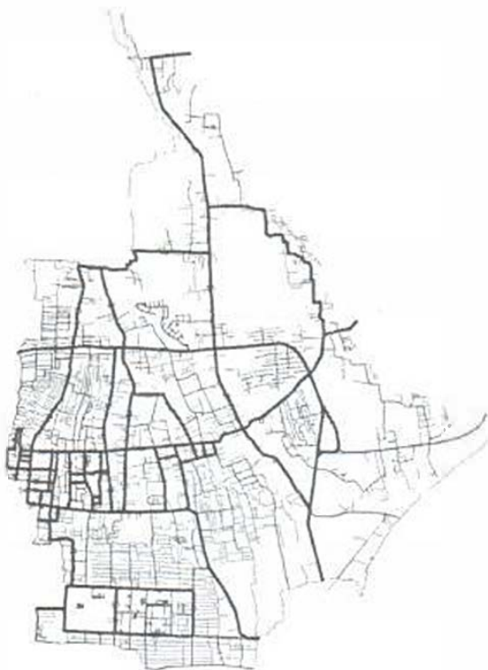
Gambar 6. Jalur Angkut Rekomendasi

dan pengoperasian. Banyaknya sampah yang harus diangkut akan memerlukan banyak truk pengangkut, dengan keterbatasan jumlah truk yang dimiliki oleh Dinas Kebersihan, rotasi truk pengangkut menjadi lebih tinggi. Kondisi tersebut menyebabkan biaya perawatan truk pengangkut akan meningkat dan masa pakai kendaraan pengangkut akan semakin pendek (Nahadi, t.t.). Proses pengangkutan sampah pada daerah pelayanan terbagi menjadi 2 shift yaitu shift I untuk angkutan pagi dan shift IV untuk angkutan malam dan jumlah jalur pengangkutan saat ini adalah sebanyak 52 jalur seperti yang ditunjukkan pada gambar 5. Proses pengangkutan cukup memakan waktu apabila tumpukan sampah terbilang cukup banyak, disamping itu proses menaikkan sampah ke bak truk juga memakan waktu sebab tidak terpusatnya titik pengumpulan sampah. Dari hasil survei, perkiraan jarak antar titik pengumpulan di jalur yang padat hunian adalah sejauh 10 m - 15 m dan rata-rata titik pengumpulan sampah sebanyak 30 titik.