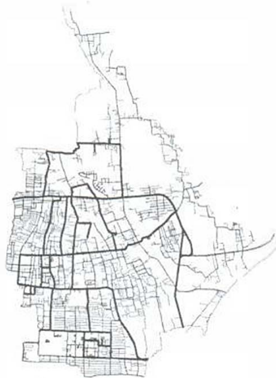
Gambar 2. Jalur Angkut Kontainer Eksisting

Gambar 2 menunjukkan jalur pengangkutan kontainer eksisting dimana akumulasi data primer