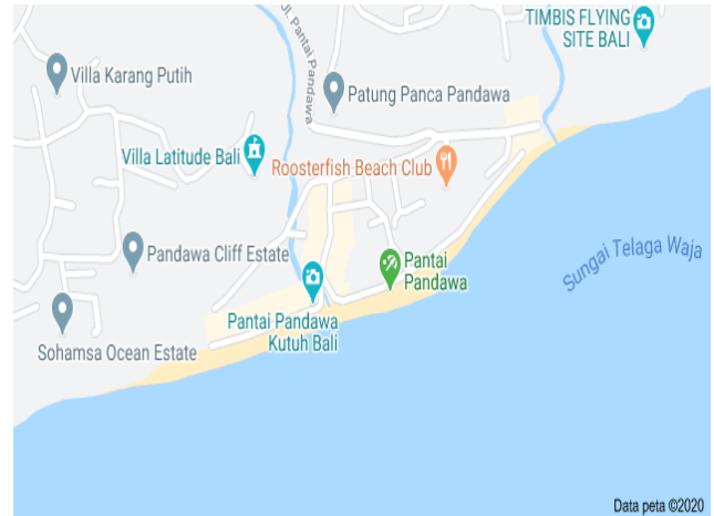
Gambar 3.1. Lokasi Pantai Pandawa

Penelitian ini dilakukan di Pantai Pandawa, Desa Kutuh, Kecamatan Kuta Selatan, kabupaten Badung. Jarak yang ditempuh adalah 18 kilometer dengan waktu perjalanan 1 jam dari Bandara Internasional I Gusti Ngurah Rai. Peneltian karena Pantai Pandawa mempunyai potensi dalam menarik minat wisatawan.