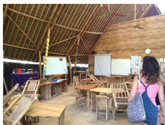
Gambar 1.1 Ruang Kelas di Green School Bali

Sekolah internasional ini membuka kelas mulai dari Preschool setara dengan pendidikan anak usia dini hingga High School yang setara dengan sekolah menengah atas. Sekolah ini mempunyai ciri khas dan keunikan tersendiri yang terlihat pada seluruh material bangunan sekolah terbuat dari bahan ramah lingkungan dan bisa didaur ulang lagi seperti kaca mobil bekas, bambu, jerami dan lumpur khusus sebagai pengganti semen demi menjaga keberlangsungan lingkungan.