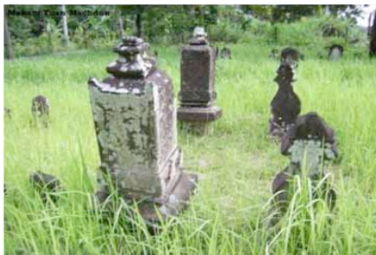
Gambar 4.3 Makam Tuan Syech Machdun