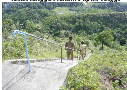
Gambar 4.2 Anak tangga Makam Papan Tinggi