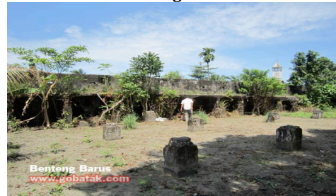
Gambar 4.4 Benteng Barus