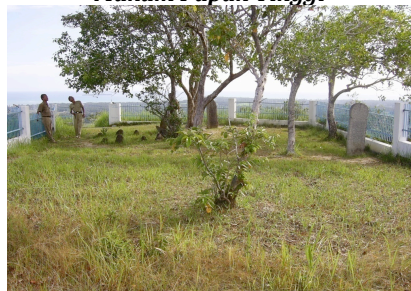
Gambar 4.2 Makam Papan Tinggi