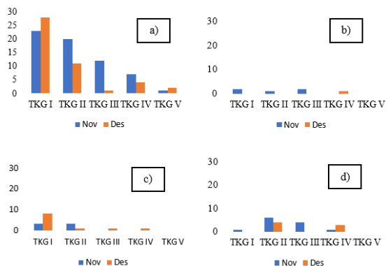
Gambar 2. Tingkat Kematangan Gonad Ikan Oskar ( Amphilopus citrinellus ) (a); Ikan Louhan ( Amphilophus sp. ) (b); Ikan Mujair ( Oreochromis mosambicus ) (c); dan Ikan Nila ( Oreochromis niloticus ) (d) pada Bulan November dan Desember di Perairan Danau Batur

Tingkat kematangan gonad (TKG) ikan Famili Cichlidae pada bulan November dan Desember untuk spesies oskar ( Amphilophus citrinellus ) terdapat pada semua tahapan TKG (I sampai V) (Gambar 2a). Lebih lanjut spesies ikan louhan ( Amphilophus sp. ) pada bulan November terdapat pada tahapan TKG I sampai III sedangkan pada bulan Desember hanya ada pada TKG IV (Gambar 2b). Ikan mujair ( Oreochromis mossambicus ) pada bulan November terdapat pada tahap TKG I sampai II sedangkan bulan Desember terdapat