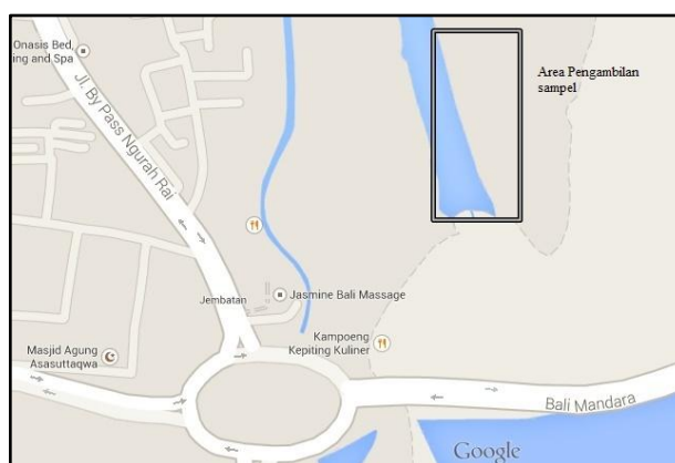
Gambar 1. Peta pengambilan sampel

Sampel sedimen diambil pada tiga titik berbeda pada satu bentangan daerah pertemuan antara air sungai dan air laut di muara Sungai Mati ( 8^{\circ} 44' 36.87'' LS, 115^{\circ} 11' 12.55'' BT) pada kedalaman \pm 10 cm, kira-kira sebanyak 1 kg menggunakan sendok plastik. Pada saat pengambilan sampel diukur suhu dan pH sedimen. Bahan sampel yang terkumpul dimasukkan ke dalam kantong plastik polietilen, disimpan dalam kotak beresid dan segera dibawa ke laboratorium.