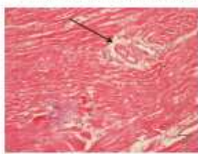
Gambar 4. Arteriola otot jantung