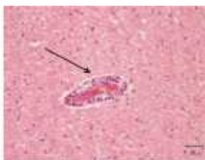
Gambar 1. Perivaskulitis pada otak

Beberapa gambar lesi histopatologi berupa infiltrasi sel limfoid pada jaringan otak, paru-paru, hati, jantung dan ginjal dapat dilihat pada Gambar berikut: