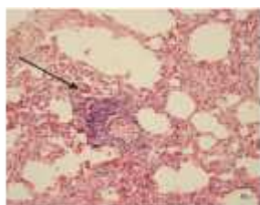
Gambar 2. Pneumonitis pada paru-paru