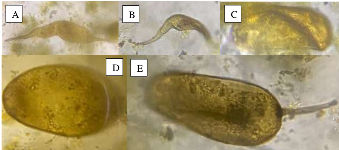
Gambar 1. Telur cacing tipe satu berwarna keemasan, A-C telur cacing berwarna kuning muda dan D dan E telur cacing berwarna kuning tua kecoklatan. Pembesaran 40x