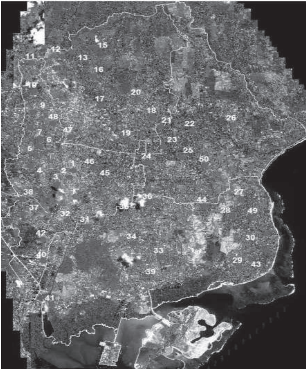
Gambar 2. Peta Lokasi Pengambilan Sampel dengan Latar Belakang Citra Ikonos

Sampel diambil di daerah permukiman Kota Denpasar dengan metode stratified random sampling . Sampel diambil secara acak dengan memberikan proporsi yang lebih banyak pada permukiman yang lebih luas. Jumlah keseluruhan sampel yang diambil adalah 50. Distribusi spasial sampel disajikan pada Gambar 1 dan Gambar 2.