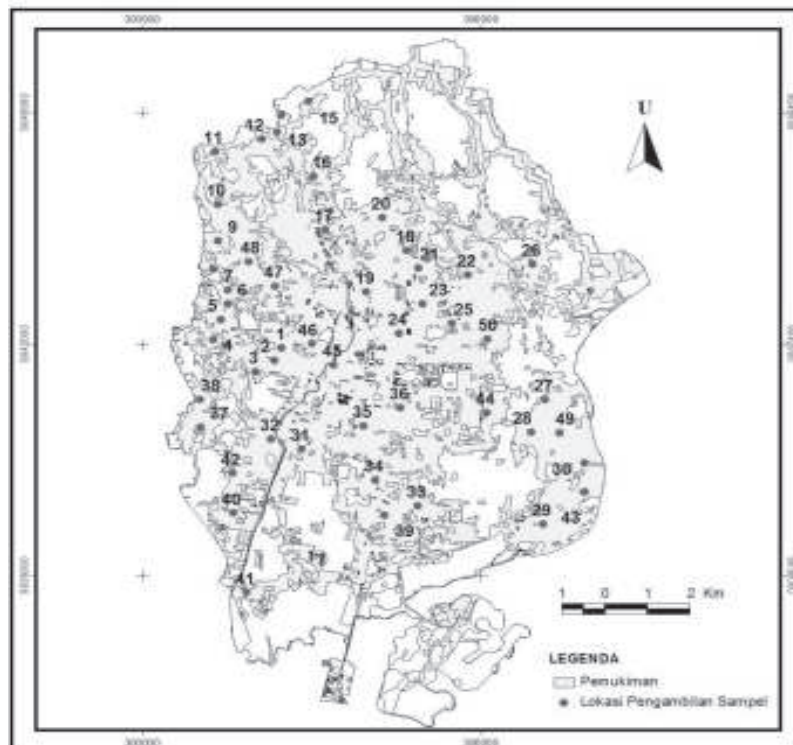
Gambar 1. Peta Lokasi Pengambilan Sampel dengan Latar Belakang Peta Rupabumi