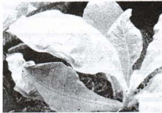
Gambar 3. Gejala nekrosis pada daun tembakau akibat inokulasi bakteri Pseudomonas spp dalam uji patogenitas

Parameter yang diamati adalah gejala yang timbul akibat uji patogenitas bakteri Pseudomonas spp pada daun tanaman indicator (tembakau), tinggi tanaman tembakau (diukur dari permukaan tanah sampai ujung daun tertinggi)