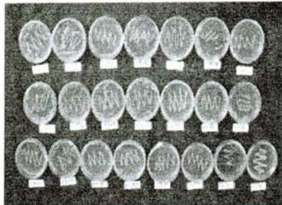
Gambar 2. Koloni bakteri Pseudomonas spp. yang terpilih ( 22 buah dari 90 sampel tanah rizosfer) yang direisolasi dalam media PPGA