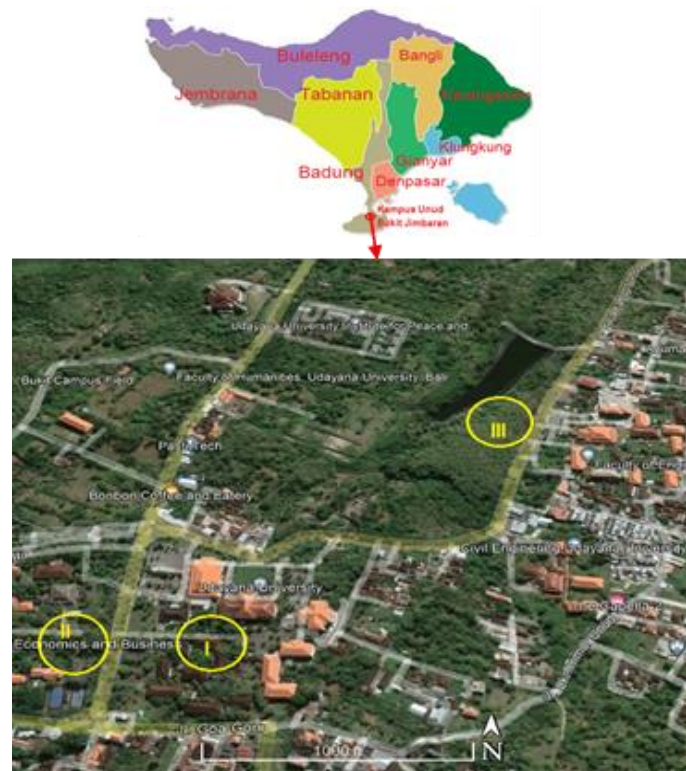
Gambar 1. Peta Penelitian