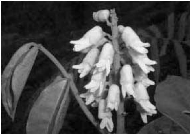
Gambar 1. E. Horsfieldii yang sedang berbunga.

Purnajiwa dapat diperbanyak dengan biji namun cara ini memiliki kendala yaitu Meskipun berbunga banyak akan tetapi biji yang dihasilkan hanya sedikit. Biji-biji tersebut juga termasuk sulit dikecambahkan (Siregar dan Peneng, 2004). Perbanyak dengan stek pun seringkali mengalami kegagalan karena stek batang dari tanaman yang termasuk famili Fabaceae seperti purnajiwa ini merupakan tanaman yang sulit membentuk perakaran (Siregar dan Peneng, 2004). Pengambilan jenis ini di alam yang berlebihan tanpa diimbangi upaya konservasi dan budidaya yang memadai mulai mengancam