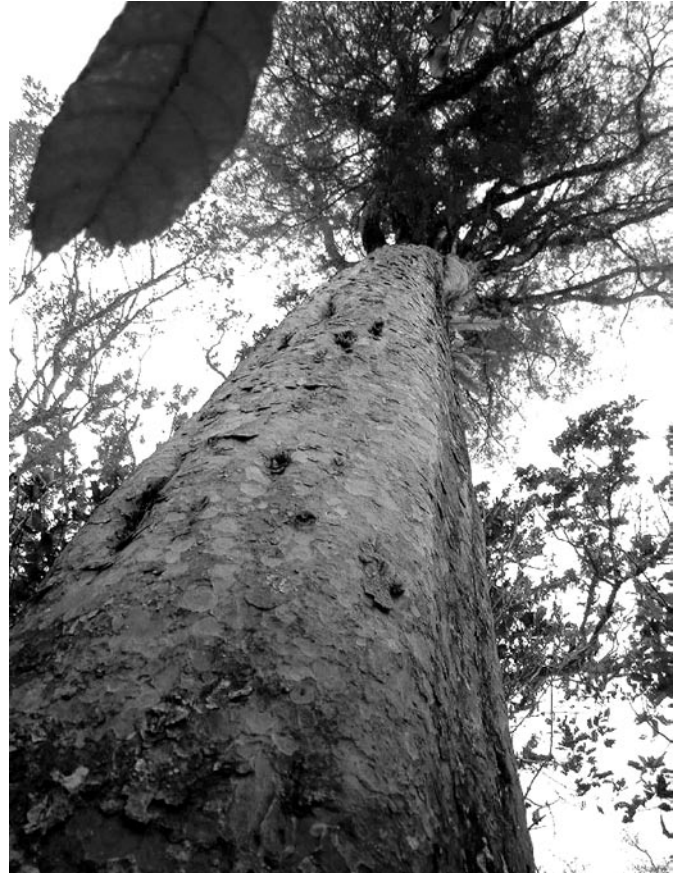
Gambar 2. Cemara pandak di Bukit Pohen