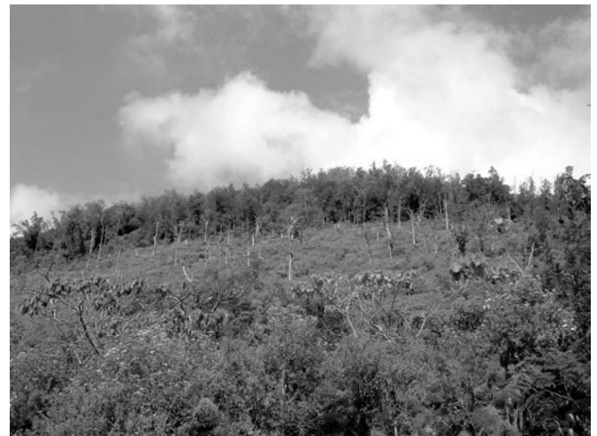
Gambar 1. Areal hutan yang terbakar di Bukit Pohen

Bukit Pohen adalah salah satu situs dari Cagar Alam Batukahu. Pada tahun 1994 kebakaran hutan terjadi dan mengakibatkan pengurangan luasan hutan sebesar 30,4 ha. Untuk mendapatkan gambaran mengenai kondisi vegetasinya dilakukan survei pada titik pengamatan di lokasi yang terkena kebakaran. Seperti terlihat pada Gambar 2, pada lokasi ini terdapat rumpang atau gap yang cukup luas akibat kehilangan penutupan tajuk hutan oleh api. Kondisi terbuka ini menyebabkan perubahan iklim mikro dan komposisi serta struktur vegetasinya. Hutan ini adalah hutan sekunder yang tengah berproses ke arah komunitas klimaks setelah terjadinya kebakaran hebat pada tahun 1994.