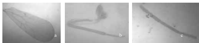
Gambar 2. Bagian tubuh yang diidentifikasi pada famili Pachytroutidae. a. Sayap depan (Pembesaran 10x40), b. Tungkai (Pembesaran 10x40), c. Antena (Pembesaran 10x40).

Genus Tapinella Enderlein. Kepala berwarna gelap, antena terdiri atas 14 ruas, berwarna coklat terang, mata hitam. Ukuran IO/D = 4,6 µm. Panjang sayap depan 146 µm, panjang sayap belakang 118 µm. Sayap depan hyalin dan agak tebal pada vena R 1 , sayap belakang hyalin . Jumlah ctenidia 26, panjang coxa 20 µm warna coklat, trochanter 8 µm, femur 39 µm, tibia 53 µm, tarsus 27 µm dengan 3 segmen dan berwarna coklat terang. Tapinella Enderlein memiliki ciri yang berbeda dengan spesimen yang diidentifikasi yaitu pertemuan antara vena radial subcosta dan vena radial pertama berbentuk persegi atau tidak runcing seperti pada vena anggota Psocoptera lainnya. Spesies yang ditemukan di Nusa Penida memiliki ciri-ciri yang sama yaitu pada venasi sayap dari spesies Tapinella spinosa .