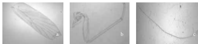
Gambar 3. Bagian tubuh yang diidentifikasi pada famili Lepidopsocidae. a. Sayap depan (Pembesaran 10x40), b. Tungkai (Pembesaran 10x40), c. Antena (Pembesaran 10x40).

Genus Pseudocaecilius Enderlein. Pada kepala terdapat garis tipis berwarna coklat pada bagian postclypeus . Ukuran IO/D = 3,4 µm. Mata hitam. Panjang sayap depan 155 µm, panjang sayap belakang 116 µm. Vena pada sayap depan berwarna coklat dan