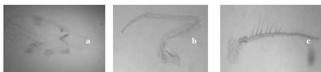
Gambar 4. Bagian tubuh yang diidentifikasi pada famili Pseudocaeciliidae. a. Sayap depan (Pembesaran 10x40), b. Tungkai (Pembesaran 10x40), c. Antena (Pembesaran 10x40).

agak tebal pada pertemuan antara vena R s dan M, warna coklat tua pada pertemuan antara vena m 1 dan m 2 dan ditutupi dengan sisik yang tebal. Jumlah ctenidia 24, panjang coxa 22 µm warna coklat tua, trochanter 9 µm, femur 33 µm, tibia 54 µm, tarsus 29 µm dengan 3 segmen dan berwarna coklat terang. Pseudocaecilius Enderlein memiliki ciri yang berbeda dengan spesimen yang diidentifikasi yaitu vena depan terdapat lebih dari satu deret setae sehingga dapat dibedakan dengan anggota Psocoptera lainnya. Spesies yang ditemukan di Nusa Penida memiliki ciri-ciri yang sama dengan Pseudocaecilius citricola yang dideskripsi oleh Thornton (1984) yaitu pada venasi sayap dan pola warna kepala yang sama.