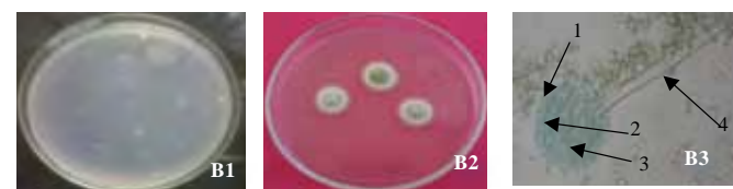
Gambar 2. Aspergillus flavus . B1. Sebalik koloni Aspergillus flavus pada media Pikovskaya , B2. Hasil reisolasi koloni Aspergillus flavus pada media PDA, B3. Mikroskopis Aspergillus flavus (Perbesaran 10x40).

Keterangan : 1. Konidia. 2. Sterigma. 3. Vesikel. 4. Konidifor