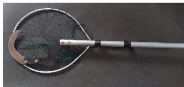
Gambar 3. Hasil rancangan.