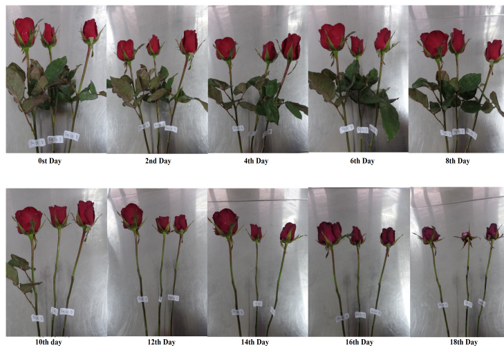
Gambar. 3. Perubahan warna bunga mawar potong dari hari ke nol sampai hari ke 18

Skor tertinggi bunga mawar potong pada perlakuan S4 (konsentrasi minuman ringan merk sprite 40%) pada hari ke 16. Menurut Pudja (2016) bahwa konsentrasi perlakuan sukrosa 30% pada bunga potong memberikan peringkat warna tertinggi.