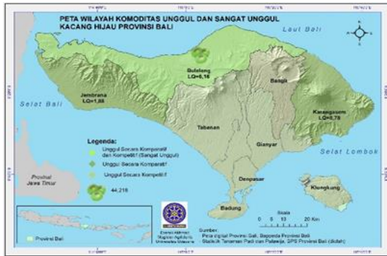
Gambar 7. Peta Wilayah Komoditas Unggul (Secara Kompetitif Atau Kompetitif) dan Sangat Unggul (Secara Kompetitif dan Kompetitif) Kacang Hijau Provinsi Bali.

Sementara itu kabupaten lain (Tabanan, Badung, Gianyar, Klungkung dan Kota Denpasar) belum dapat dikategorikan sebagai wilayah yang menghasilkan komoditas kacang hijau unggul, baik secara komparatif maupun kompetitif. Hal ini dikarenakan nilai analisis LQ kurang dari 1 dan nilai pertumbuhan pangsa wilayah negatif. Sedangkan Kabupaten Bangli tidak terdapat produksi kacang hijau.