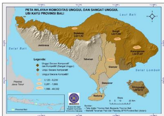
Gambar 4. Peta Wilayah Komoditas Unggul (Secara Komparatif Atau Kompetitif) dan Sangat Unggul (Secara Komparatif dan Kompetitif) Ubi Kayu Provinsi Bali.

Hasil analisis komoditas ubi kayu dengan pendekatan keruangan di Provinsi Bali seperti yang terlihat pada gambar 4 menunjukkan komoditas ubi kayu menjadi komoditas sangat unggul di Kabupaten Karangasem, Bangli dan Kabupaten Buleleng. Terlihat potensi basis (keunggulan komparatif) ubi kayu di Kabupaten Karangasem cukup besar dengan nilai koefisien LQ mencapai 11,67. Nilai koefisien LQ Kabupaten Bangli mencapai 1,66. Sedangkan potensi ubi kayu di Kabupaten Buleleng juga menjadi basis dengan nilai koefisien LQ 1,52. Disamping memiliki keunggulan komparatif (basis), kedua kabupaten tersebut juga memiliki keunggulan kompetitif.