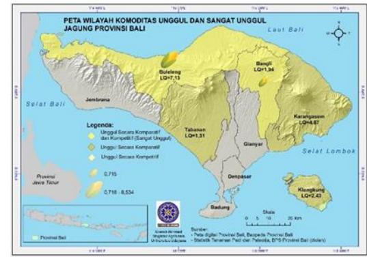
Gambar 2. Peta Wilayah Komoditas Unggul (Secara Komparatif Atau Kompetitif) dan Sangat Unggul (Secara Komparatif dan Kompetitif) Jagung Provinsi Bali.

Sedangkan di kabupaten lain yaitu Kabupaten Jembrana, Badung, Gianyar dan Kota Denpasar tidak terdapat komoditas jagung yang unggul secara komparatif maupun unggul secara kompetitif. Hasil analisis dengan pendekatan keruangan secara lengkap tersaji dalam peta wilayah komoditas jagung unggul dan sangat unggul pada gambar 2.