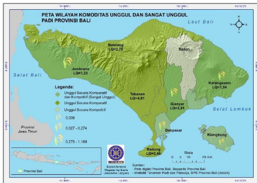
Gambar 1. Peta Wilayah Komoditas Unggul (Secara Komparatif Atau Kompetitif) dan Sangat Unggul (Secara Komparatif dan Kompetitif) Padi Provinsi Bali.

Wilayah-wilayah lain sebagai wilayah pendukung dalam produksi padi Bali seperti Badung secara komparatif juga mempunyai share yang berlebih yang dapat didistribusikan ke wilayah yang kurang. Akan tetapi komoditas padi di wilayah tersebut tidak mempunyai keunggulan kompetitif.