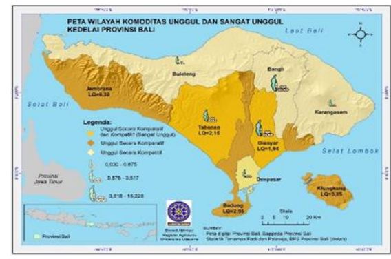
Gambar 3. Peta Wilayah Komoditas Unggul (Secara Komparatif Atau Kompetitif) dan Sangat Unggul (Secara Komparatif dan Kompetitif) Kedelai Provinsi Bali.

Menurut hasil analisis peta wilayah komoditas unggul dan sangat unggul pada komoditas kedelai di Provinsi Bali menunjukkan Kabupaten Tabanan dan Kabupaten Gianyar sebagai wilayah dengan komoditas kedelai sangat unggul. Komoditas kedelai di kedua kabupaten tersebut selain unggul secara kompetitif juga unggul secara komparatif (basis).