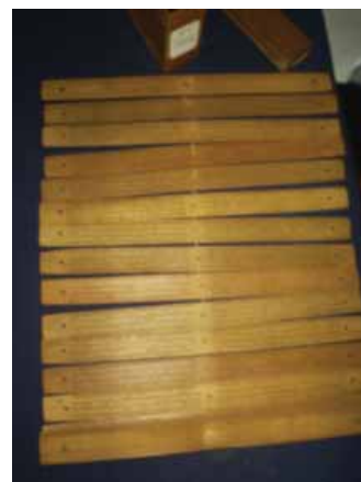
Gambar 3. Lontar Kakawin Bharatayudha koleksi Perpustakaan Lontar FS Univ. Udayana