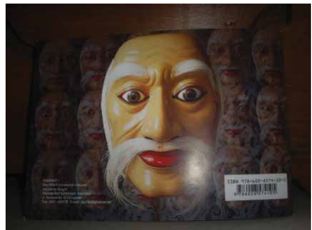
Gambar 2. Produk Buku Perang Bharata Tampak Belakang.